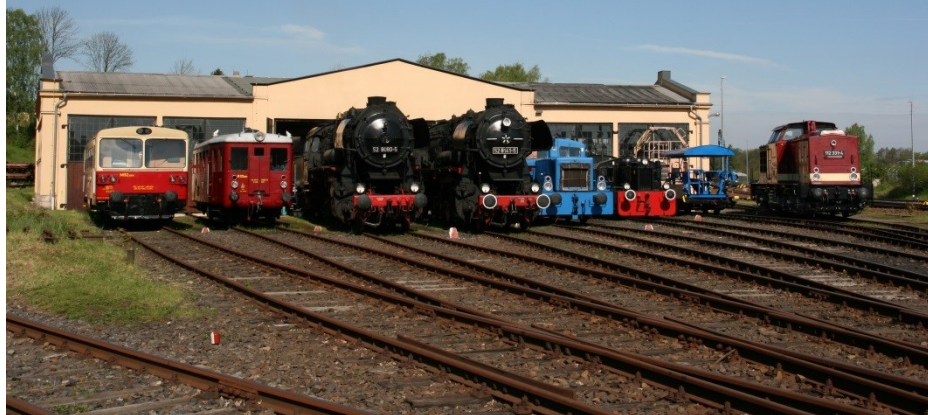
Depo Löbau