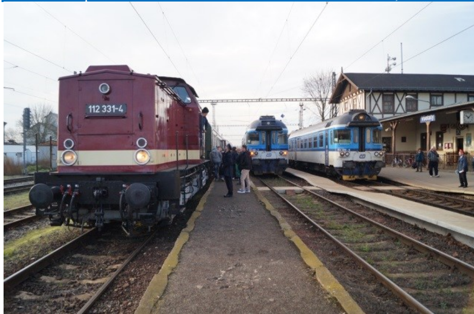
OSEF-Sonderzug trifft in Všetaty auf ČD-Triebwagen