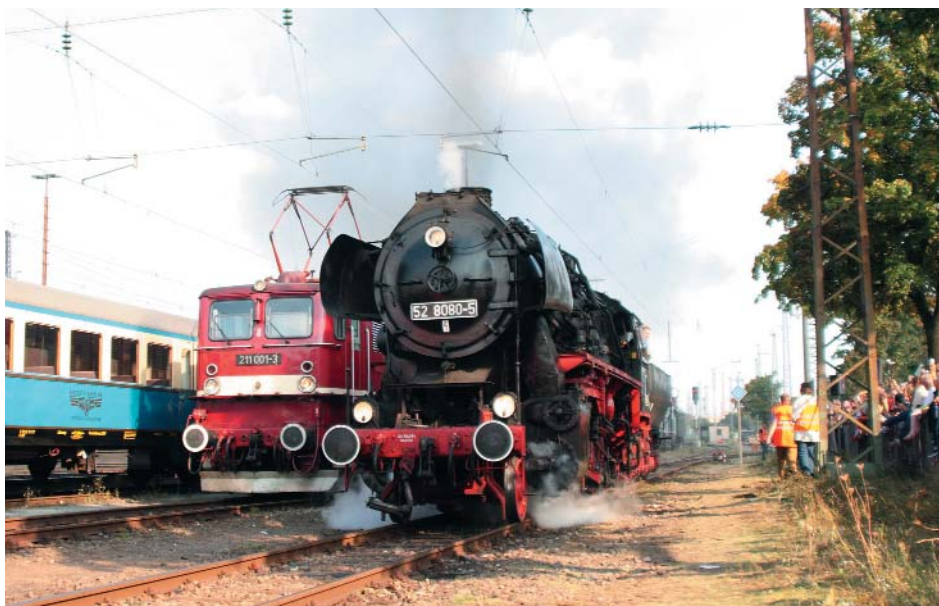
Ankunft Eisenbahnstadt Fürth: 52 8080-5 zur Lokparade am 16.09.2007