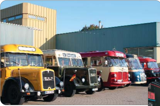
Busausstellung auf dem Gelände bei der infra fürth verkehr gmbh