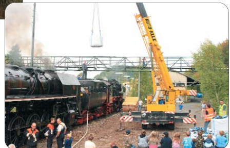
Zwei »alte Damen« ... ein kleines Volksfest ... so etwas hat auch die Bundespolizei in Schirnding noch nicht erlebt!