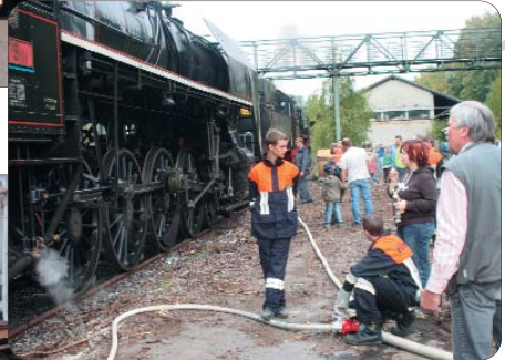
Feuerwehr Schirnding im vollen Einsatz