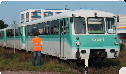
Perkenaxe auf 1. Endstation zwischen Fürth und Nürnberg-Nordost