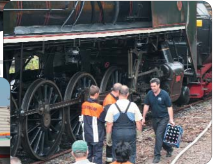
Gegenseitiges Wassernehmen ... Danke ... an die Feuerwehr