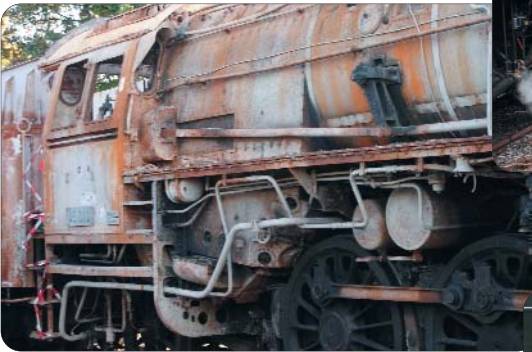
45 010 ... Opfer der Flammen beim Großbrand im DB Museum Nürnberg